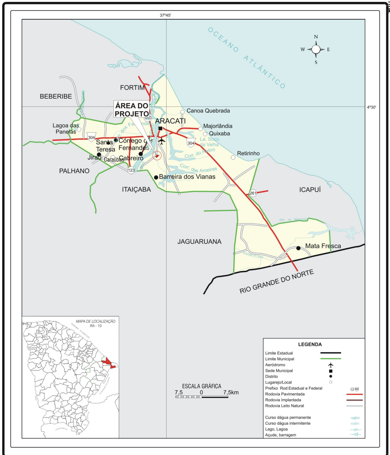
Figura 3.1 – Localização e Acesso da Área do Empreendimento

A situação cartográfica da área do empreendimento é apresentada na Figura 3.3.